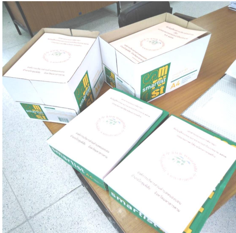
รูปเล่มจ้างเหมาถ่ายเอกสารและเข้าเล่มข้อบัญญัติงบประมาณรายจ่ายประจำปี งบประมาณ พ.ศ.๒๕๖๖